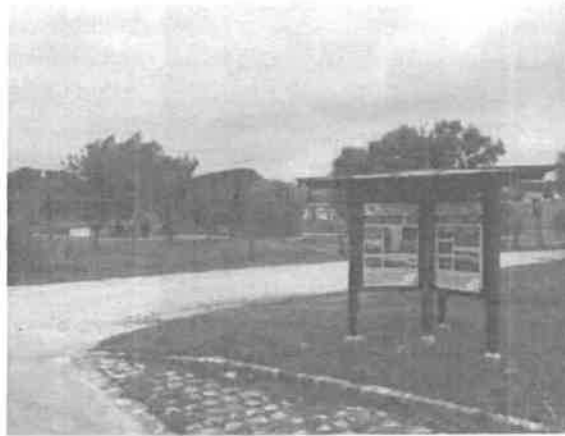
Gerecse Natúrpark információs pont